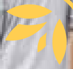
Bygging og innredning av et helt insektshotell var en populær aktivitet på Sirkulas stand på Stoppested Verden.