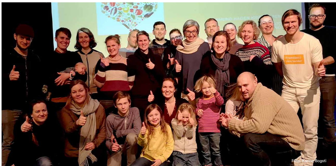
En stor del av familiene som deltok i prosjektet og reduserte matsvinnet sitt mye med enkle grep.

I snitt kaster vi 42 kilo spiselig mat hver i året. I januar satte Sirkula i gang prosjektet matVinn i samarbeid med organisasjonen Framtiden i våre hender, for å bevisstgjøre befolkningen om problemet. Prosjektet ga resultater: Med enkle grep kastet de 15 småbarnsfamiliene som deltok, i snitt 75 prosent mindre spiselig mat etterpå.