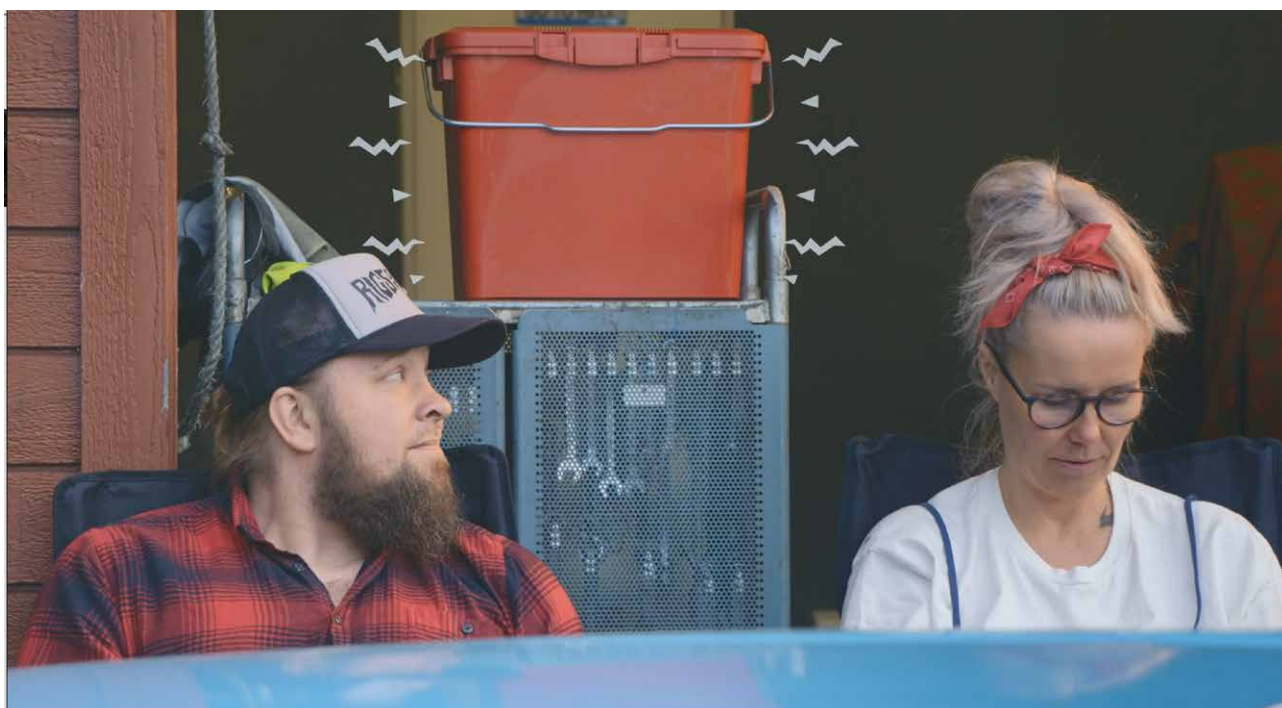
Klipp fra en av fire filmer som ble annonsert i sosiale medier i 2019 for å øke innsamlingen av farlig avfall. Budskap var hva som er farlig avfall, og husk å bruke den røde boksen til oppsamling og levering.

Det ble også innført betaling for levering av alt restavfall på gjenvinningsstasjonene.