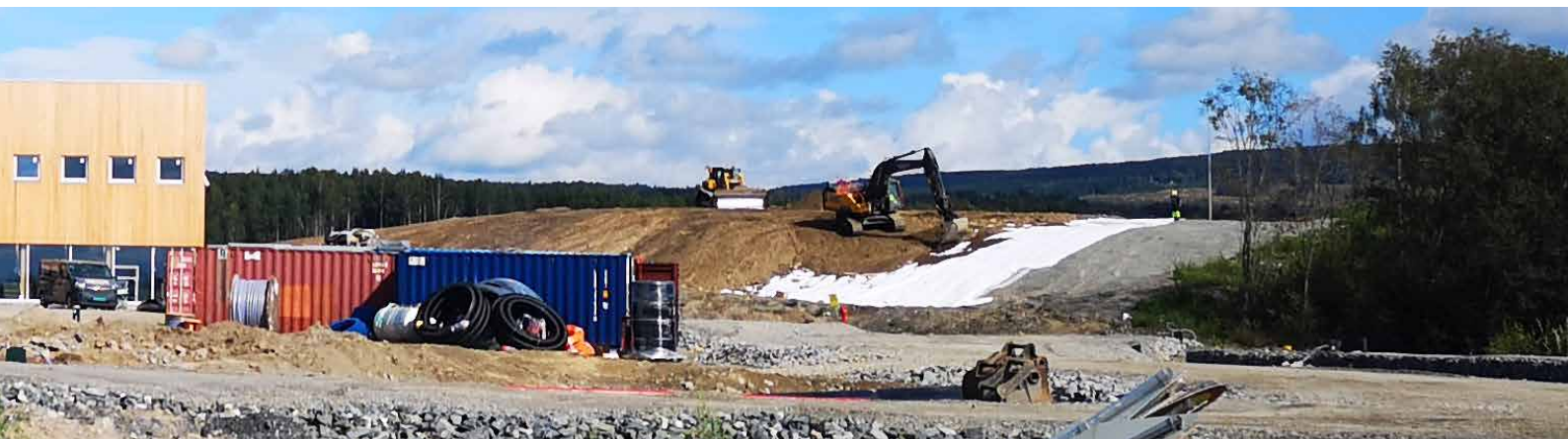
Den gamle Gålås-fyllinga ble forskriftsmessig tildekket i 2019, og nye rør lagt i den for å utnytte all gassen som dannes til oppvarming på anlegget.

Syljuåsen er en miljøfyrtårnsertifisert bedrift, og 83,5 prosent av avfallet fra utbygginga er utsortert.