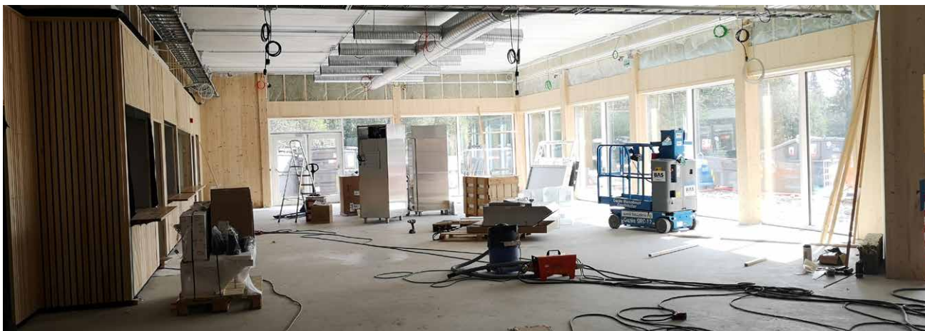
Bygget er det første i sitt slag i Norge, hvor vegger i massivtre er brukt som bærende element for så store tak-/gulvflater mellom etasjene. Umalte trevegger er bra for inneklima og trivsel for de som oppholder seg i slike rom.

Innendørs sørger ubehandlede massivtrevegger i gran for et godt inneklima. Tre er et levende og pustende materiale som har evne til å ta opp og avgir fuktighet og temperaturendringer, og skaper et godt innemiljø. Forskere studerer nå treets positive effekt på astma, tørre øyne og slimhinner, virus, influensasmitte og psykisk helse. Foreløpige funn viser at synlig tre på jobben bedrer trivsel og konsentrasjon, og reduserer stress. Effekten blir større jo mer tre du ser.