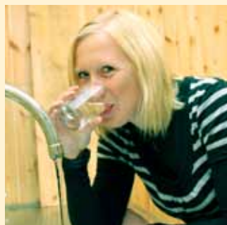
Mjøsvann under lupen side 6