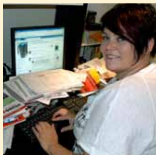
Endelig papirdunk side 4