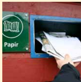
Forvandles til... side 7