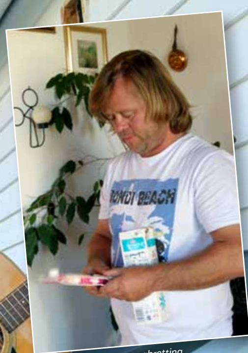
Familiens sjef for kartongbretteing.