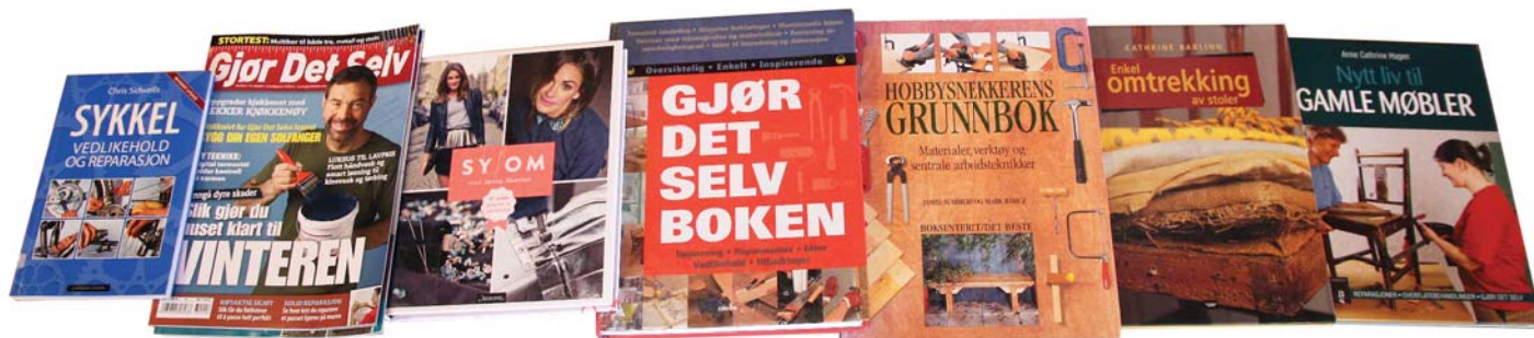
Hvordan kan en reparere, fikse og redesigne? Biblioteket har godt utvalg av både bøker og blader du kan låne.