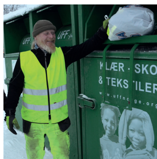
GI TØY NYTT LIV side 6