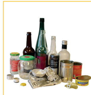
REKORD-SORTERING PÅ HEDMARKEN side 8