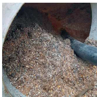
KASTER 900 TONN GRUS I MATAVFALLET side 5