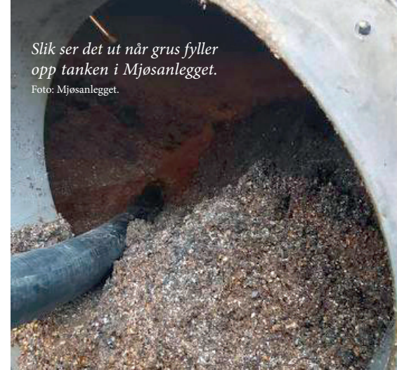
Slik ser det ut når grus fyller opp tanken i Mjøsanlegget.