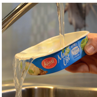
RENGJORT PLAST ER BEST side 7